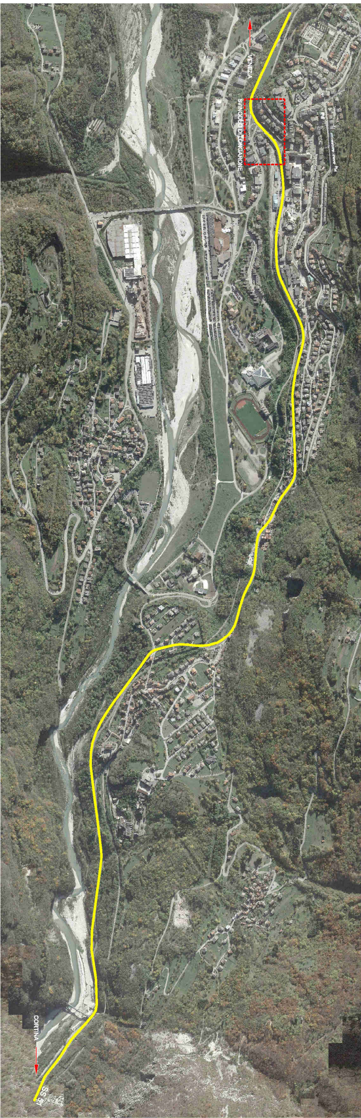
FOTONSERIMENTO INTERVENTO MIGLIORAMENTO PRESTAZIONALE DELLA SS n.51 tra il Km 49+600 ed il Km 53+570 scala 1:5000